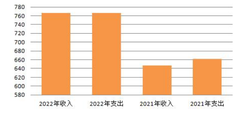
2021年-2022年财政拨款收支情况

3. 国有资本经营预算财政拨款本年收入0万元，比上年增加0万元，增长0%；本年支出0万元，比上年增加0万元，增长0%。